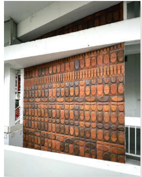
Carreaux modulaires en terre cuite, Réf. Créteil. Maison Carré