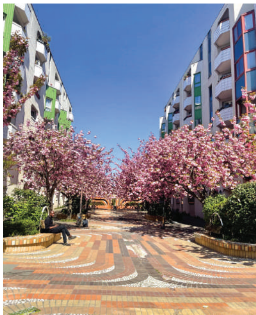
La Nature en ville, un espace pour tous : cerisiers plantés selon le souhait de l'artiste et jardinières avec bancs intégrés

Une approche qui nie le droit moral de l'artiste, garantissant le respect de l'intégrité de l'œuvre. En 2024, la famille de l'artiste contactée apprend que la destruction est imminente, sans précision de date. On fait comprendre que toute opposition est inutile. On leur propose de démonter l'œuvre, de récupérer les matériaux, puis de confier la réalisation d'une nouvelle œuvre à un groupe d'artistes.