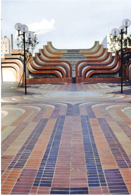
1986 Archive Gianferrari. Fresque et sol forment un tout indissociable

La Ville invoque : le sol fragile, le détour des nouvelles canalisations trop coûteux. Même si aucune étude n'a été réalisée. Ces arguments finissent par disparaître. La Mairie du 18 e l'assume : ce n'est plus un problème technique mais un choix d'urbanisme. Une décision prise dès le lancement du projet, dans une logique qui efface tout ce qui ne figure pas sur le plan initial. Pas de place pour l'existant. La mosaïque n'entre pas dans le projet prévu, alors elle doit disparaître.