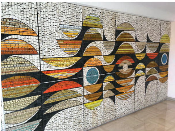
Résidence Le Mas de Tanit, Antibes, architecte Levy-Chemla

Le projet d'aménagement a commencé sur le terrain : les premières opérations sont en cours, les engins de chantier circulent à proximité. L'avancement du programme devient visible. Pourtant, aucune date officielle de destruction n'a été communiquée. Il est possible - techniquement, symboliquement, collectivement - de ne pas commettre l'irréparable. De faire le choix d'une préservation intelligente, de la mémoire vivante. Et de montrer que l'on peut bâtir la ville de demain sans effacer ce qui a fait sa force d'hier.