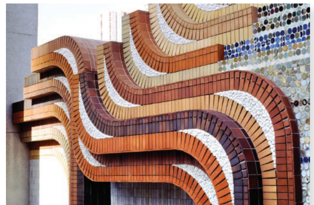
1986 Archive Gianferrari. Mosaïque en terre cuite, galets blancs et tesselles émaillées